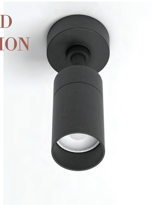
+ SLIM GU10 Ceiling pag 251