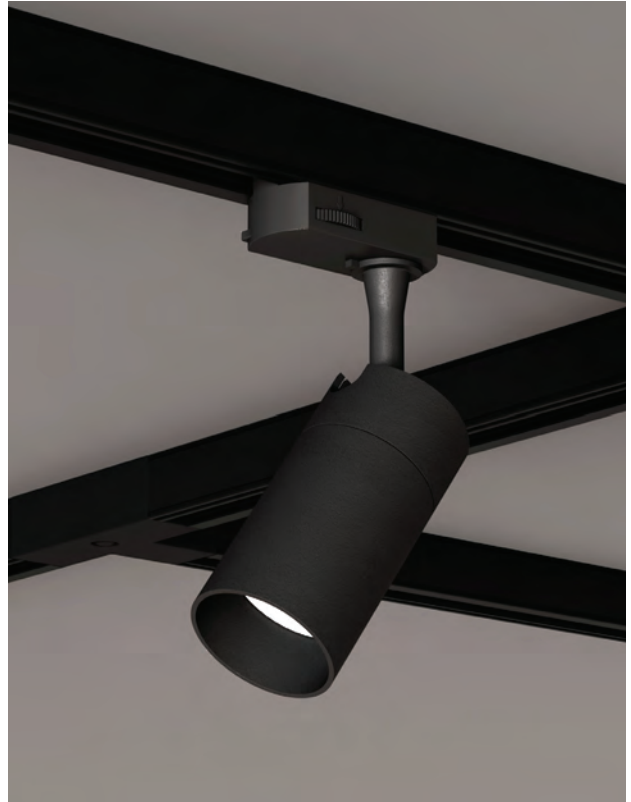
+ SLIM GU10 Track pag 198